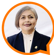
Panel: Salud mental