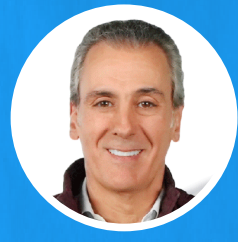
JOSÉ CHEDRAUI BUDIB